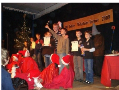
Das Nikolausturnier (in der Max-Planck-Schule Kiel)

Im Dezember richten wir in Zusammenarbeit mit der Max-Planck-Schule das „Nikolausturnier“ aus. Seit 1978 messen sich Schulschachmannschaften aus ganz Schleswig-Holstein in diesem Wettkampf, in der Regel ca. 300 Kinder.