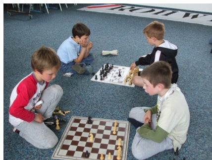
Schach in der Schule (in der Grundschule Eidertal-Molfsee)

INTERESSIERT? Bestimmt ist es auch möglich, an der Schule, die Ihr Kind besucht, mit Unterstützung der Schulleitung eine Schach-AG bzw. einen Schachkurs einzurichten. Weitere Informationen können Sie auf unserer Website finden. Wenn Sie Kontakt mit uns aufnehmen, klären wir gerne Einzelheiten in einem persönlichen Gespräch.