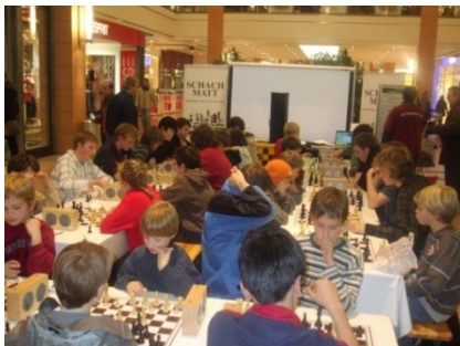
Das KJUST (im CITTI-PARK Kiel)

Wir organisieren an 10 Terminen jedes Schuljahres seit 2005 das „Kieler Jugend- und Schulschachturnier“ (KJUST) als Grand-Prix-Serie im Bereich des Schachbezirks Kiel.